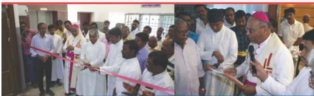
Blessing of the Renovated Hall – Erukkancherry