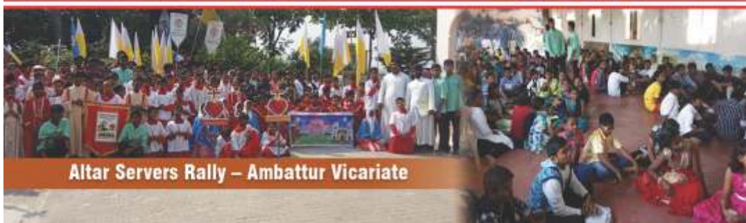
Altar Servers Rally - Ambattur Vicariate