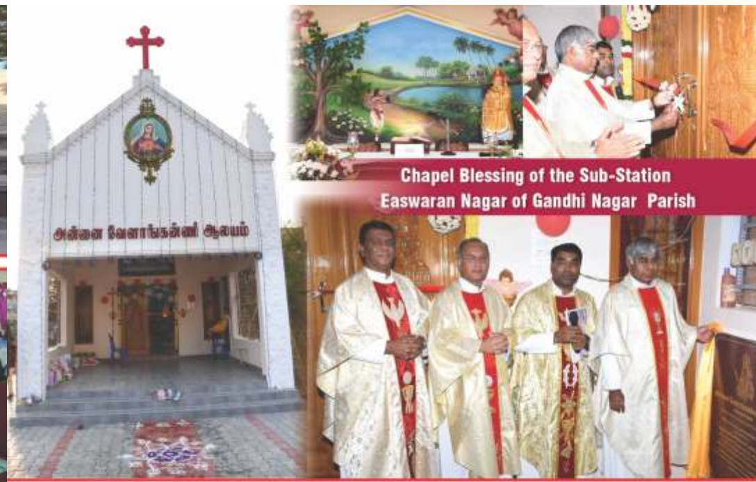
Chapel Blessing of the Sub-Station Easwaran Nagar of Gandhi Nagar Parish