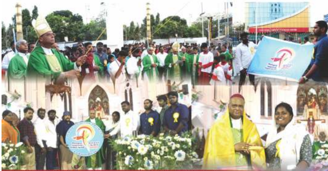
Year of Youth Opening Ceremony – Santhome Cathedral