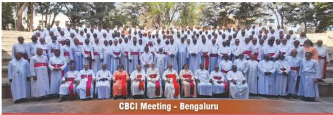
CBCI Meeting - Bengaluru