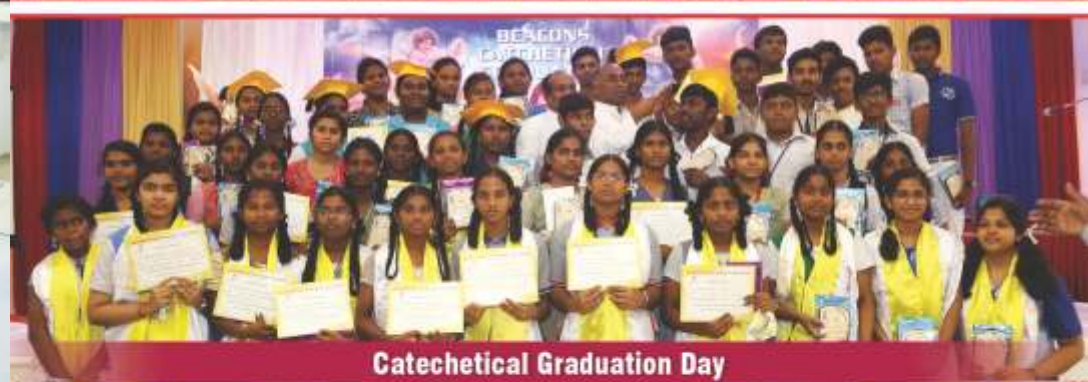
Catechetical Graduation Day