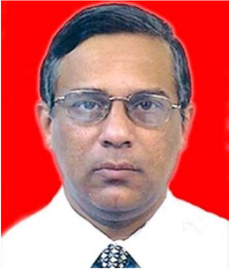
cal Education, North India.

The Catholic layman from Mumbai has been a member of the CBCI Finance Committee for the past seven years and has assisted many dioceses. He is also a member of the governing board of the CBCI Society for Medi-