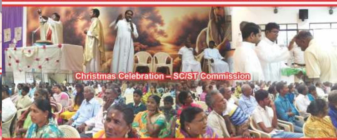
Christmas Celebration – SC/ST Commission