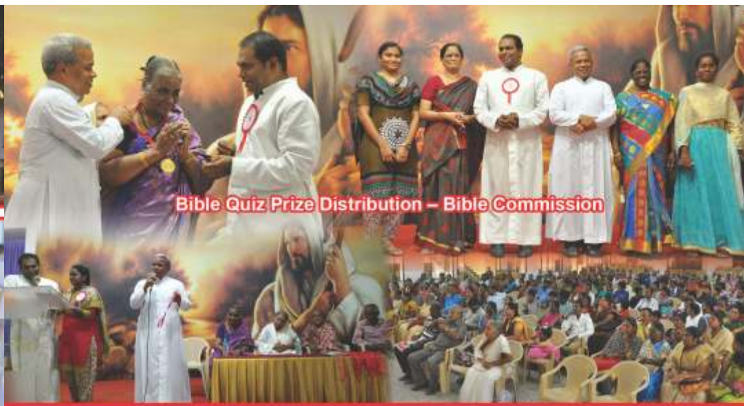
Bible Quiz Prize Distribution – Bible Commission