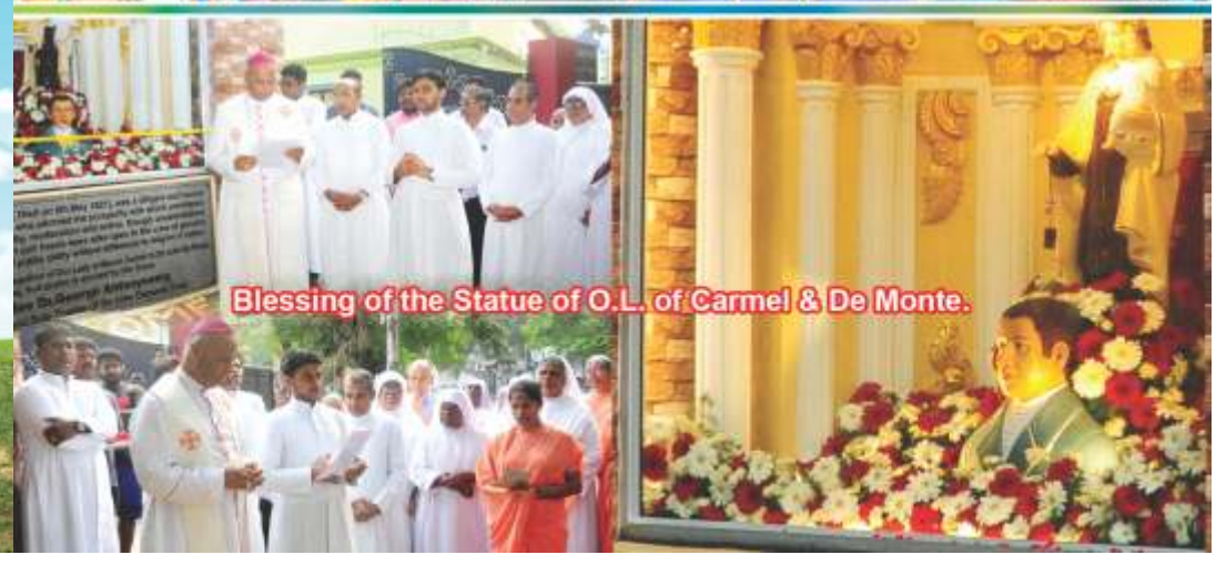
Blessing of the Statue of O.L. of Carmel & De Monte.