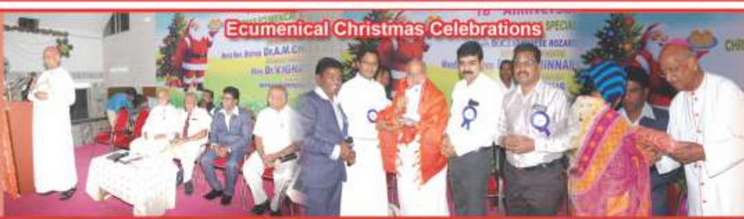
Ecumenical Christmas Celebrations