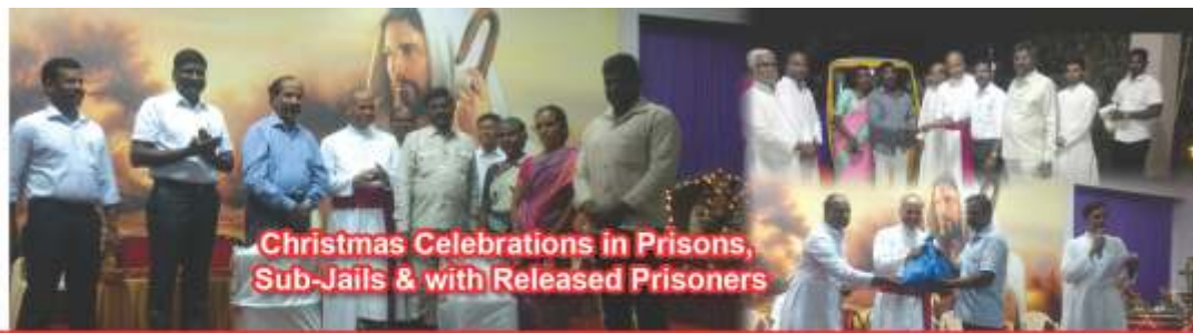
Christmas Celebrations in Prisons, Sub-Jails & with Released Prisoners