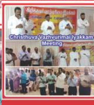
Christhuva Vazhvirimaliyakkam Meeting