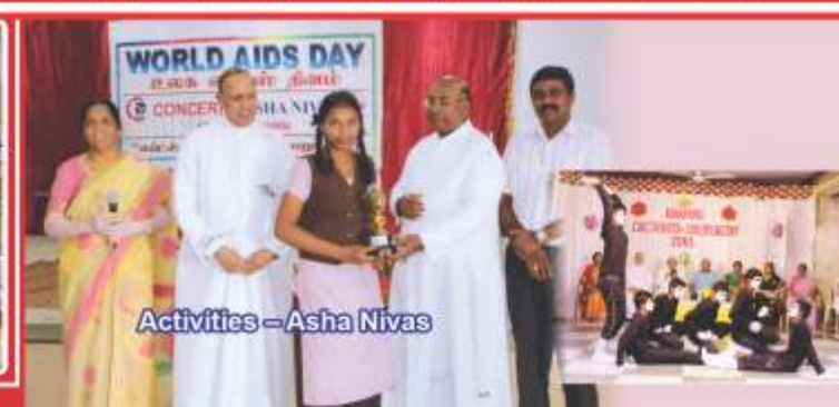
Activities – Asha Nivas