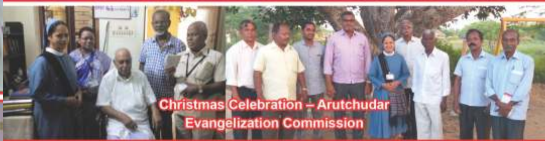
Christmas Celebration – Arutchudar Evangelization Commission