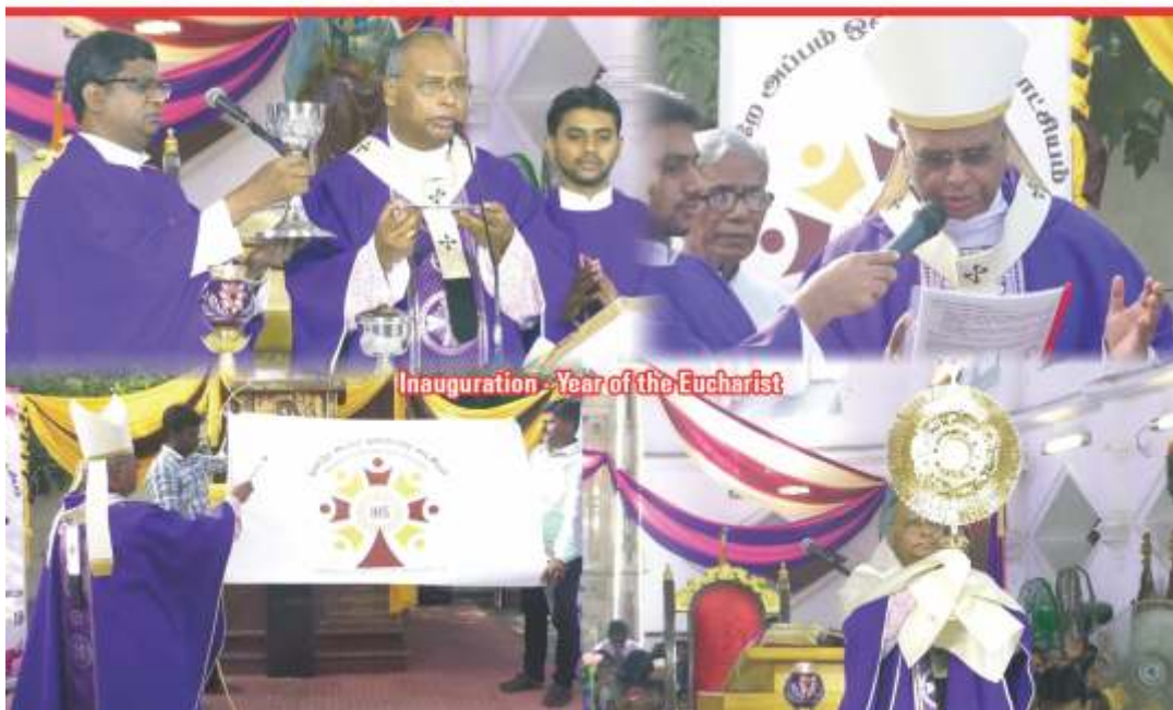
Inauguration - Year of the Eucharist

Hearty Congratulations and Prayerful wishes to the Golden & Silver Jubilarians