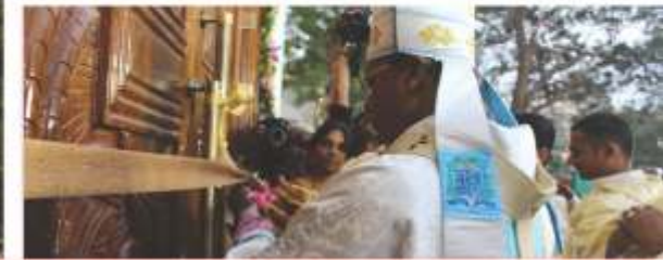
Blessing of the New Church – Anna Nagar