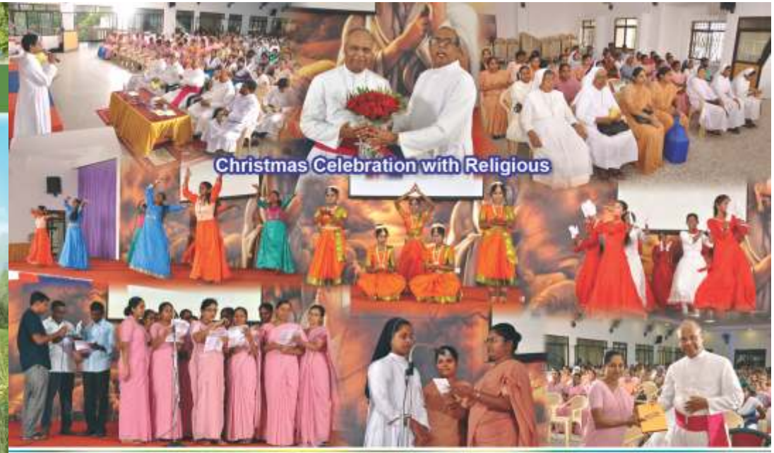
Christmas Celebration with Religious