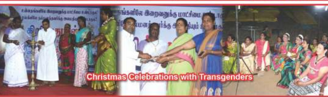
Christmas Celebrations with Transgenders