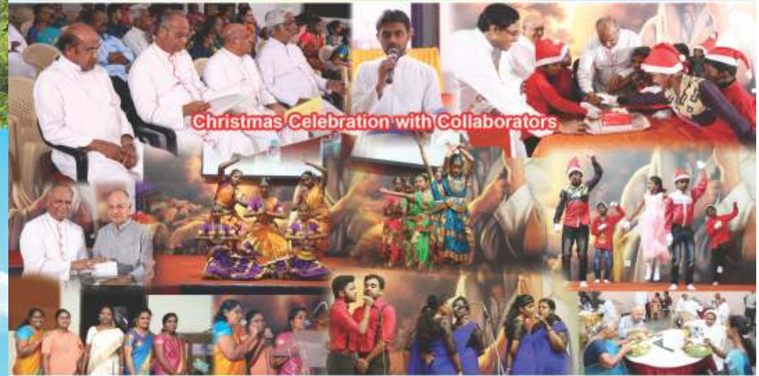
Christmas Celebration with Collaborators